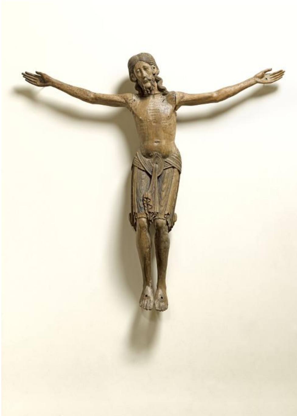
Houten Christusbeeld, Auvergne, tweede helft 12e eeuw Musée de Cluny

Oud-Katholieke parochie van Petrus & Paulus, Johannes & Willibrordus Amsterdam & Aalsmeer